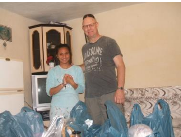
Project in 2019: Het uitreiken van voedselpakketten

Deze doelstellingen kunnen gerealiseerd worden door sponsoracties en giften van zowel bedrijven als particulieren. Dit gebeurt o.a.. Door brieven aan bedrijven en scholen te schrijven, het uitdelen van flyers op jaarmarkten, het ophangen van spandoeken en het geven van presentaties.