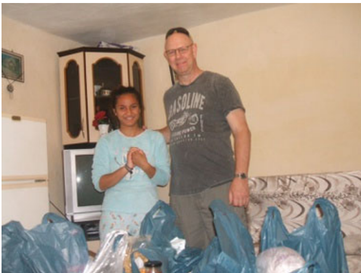
Een van de projecten: Het uitreiken van voedselpakketten

Deze doelstellingen kunnen gerealiseerd worden door sponsoracties en giften van zowel bedrijven als particulieren. Dit gebeurt o.a.. Door brieven aan bedrijven en scholen te schrijven, het uitdelen van flyers op jaarmarkten, het ophangen van spandoeken en het geven van presentaties.